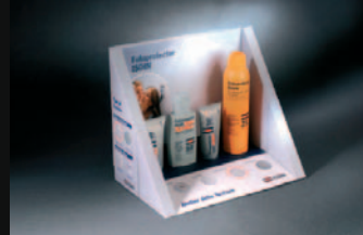
Isdin - Pack Texturas