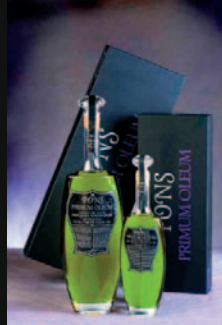
Pons Primum Oleum