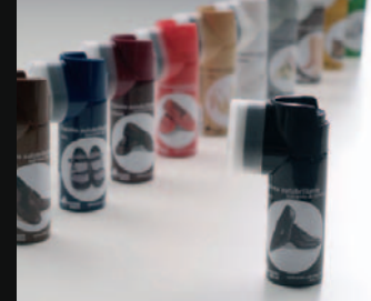
Aplicador Limpiacalzado Espuma Aerosol