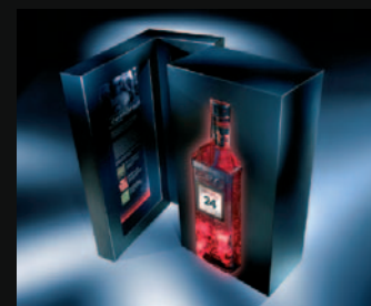
Beefeater 24 - Premium